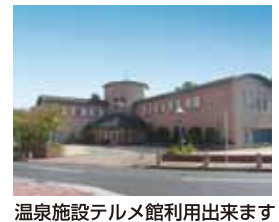
温泉施設テルメ館利用出来ます

人気の6階、通気性良好 リビングにエコカラット (INAX社製)使用 結露が出来ない